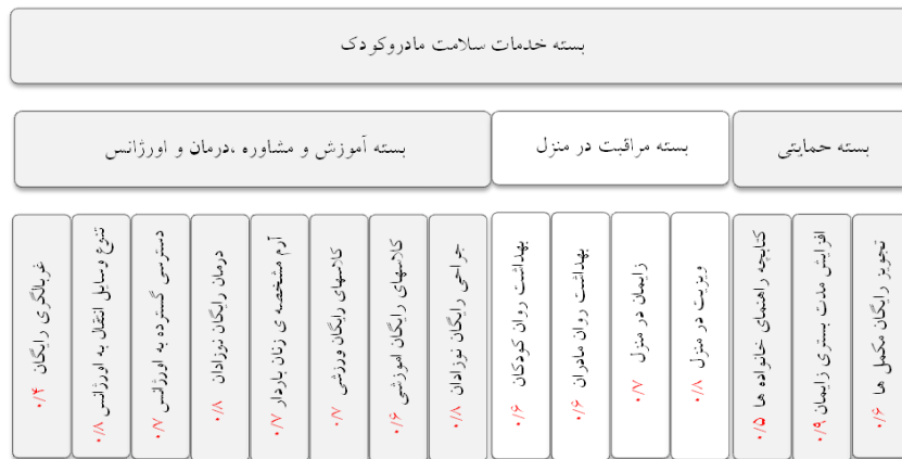
شکل ۲- مدل بسته خدمات سلامت مادر و کودک با توجه به یافته‌های مطالعه تطبیقی و بار عاملی آن‌ها