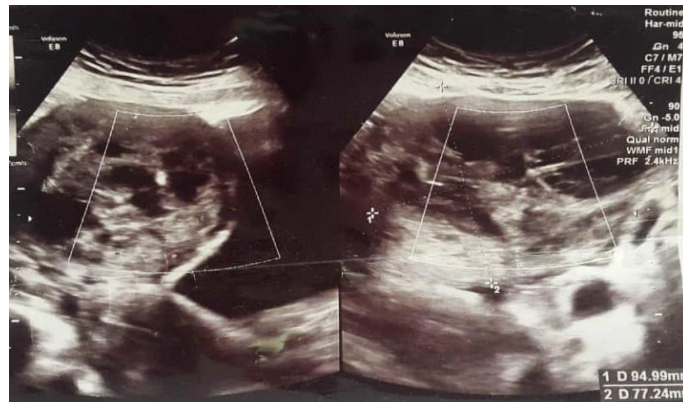
تصویر ۱- سونوگرافی قبل از عمل جراحی

بیمار خانم ۳۷ ساله با سابقه یک‌بار حاملگی، یک‌بار زایمان طبیعی با شکایت آمنوره به مدت ۳ ماه، به پزشک مراجعه و تحت ارزیابی قرار گرفت. بیمار سابقه بیماری خاص و مصرف دارو داخلی نداشت. چاق نبود و علائم هیرسوتیسم نداشت و در معاینه دو دستی لگنی، توده سفت، متحرک و فاقد درد در آدنکس سمت راست به دست می‌خورد. در آزمایشات ارسال شده، سطح تورمو مارکرها و آزمایشات هورمونی نرمال بود. در سونوگرافی واژینال، توده هتروژن سالیدکیستیک ۸۰*۱۰۰*۱۱۰ میلی‌متر در آدنکس راست همراه با مایع آسیت متوسط در لگن گزارش شد (تصویر ۱).