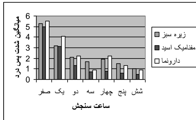
نمودار ۱- مقایسه میانگین شدت پس درد در ساعات صفر تا شش در سه گروه مورد مطالعه بعد از مداخله

از زیره سبز و در گروه سبز بیشتر از گروه مفنامیک اسید بود (نمودار ۲). بر اساس آزمون کروسکال والیس، سه گروه از نظر میانگین دفعات سنجش درد طی دوره ارزیابی شدت پس درد، تفاوت آماری معنی داری داشتند ( p=5/627 , F=2 , df=0/060 ).