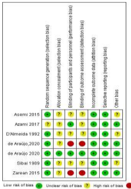
شکل ۱- کیفیت مقالات مورد مطالعه به‌صورت فردی بر اساس ابزار گروه کوکران

(کورسازی تحلیل‌گر آماری)، ریزش نمونه (خارج شدن از مطالعه بعد از تصادفی‌سازی)، سوگیری گزارش انتخابی پیامدها و دیگر سوگیری‌ها مورد بررسی قرار گرفتند. هر یک از آیتم‌های مورد بررسی در این ابزار به‌صورت کم‌تورش، تورش متوسط و مبهم از نظر تورش‌ها گزارش می‌شود (۱۶). بر اساس فرآیند، بررسی کیفیت مقاله توسط دو نفر پژوهشگر انجام شد و در مواردی که عدم توافق وجود داشت، با مشارکت پژوهشگر سوم و رسیدن به اجماع ارزیابی انجام شد. در نهایت پس از انتخاب مطالعات، داده‌ها از طریق چک‌لیست محقق‌ساخته استخراج شدند. این چک‌لیست حاوی اطلاعاتی مانند نام نویسندگان، سال، سن گروه هدف، نوع مداخله، گروه کنترل، نوع مطالعه،