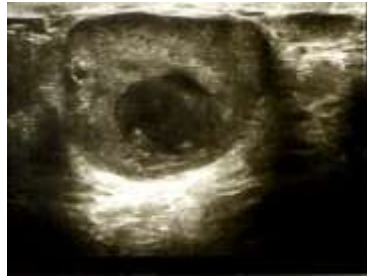
تصویر ۵- سرطان پستان در دوران حاملگی و شیردهی. سونوگرافی توده پستان سرطان پستان در دوران حاملگی و شیردهی. در این تصویر توده با حاشیه منظم با نمای تشدید صوت در سطح خلفی توده رؤیت می‌گردد. بیوپسی و بررسی هیستولوژیک مؤید کارسینوم مدولری بود.

در برخی تعاریف تمامی سرطان‌های پستان که در دوران حاملگی و یا در زمان شیردهی صرف‌نظر از فاصله زمانی تشخیص بیماری تا ختم حاملگی تشخیص داده شده‌اند، در این گروه از سرطان‌های پستان قرار می‌گیرند (۱، ۲).