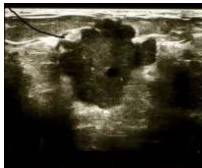
تصویر ۲- سرطان پستان در دوران حاملگی و شیردهی. سونوگرافی توده پستانی در این تصویر توده هیپواکوئیک با شکل نامنظم و با حاشیه نامنظم را نشان می‌دهد که محور طولی آن، عمود بر سطح برست