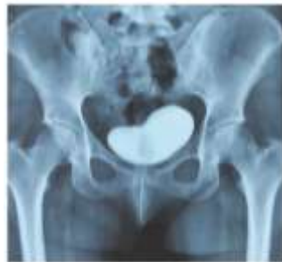
شکل ۲- سیستوگرافی انجام شده پس از ۳ ماه درمان نگهدارنده

بیمار تحت اقدامات حمایتی شامل کاتتریزاسیون مثانه با سوند فولی به مدت ۳ ماه، تجویز آنتی‌بیوتیک و آنتی‌کولینرژیک ادراری قرار گرفت. پس از انجام مجدد