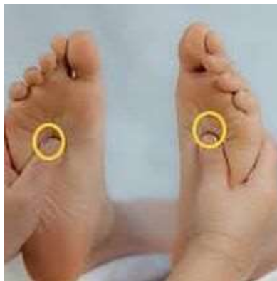
شکل ۱- محل نقطه بازتابی شبکه خورشیدی کف پا

با توجه به اهمیت تسکین علائم تهوع و استفراغ در دوران بارداری و با توجه به اینکه اکثر مطالعات انجام شده تاکنون با هدف تعیین اثر رفلکسولوژی بر تهوع و استفراغ ناشی از عللی غیربارداری انجام شده‌اند و تاکنون تحقیقی در مورد تأثیر رفلکسولوژی شبکه خورشیدی کف پا بر تهوع و استفراغ حاملگی در سطح ایران و جهان یافت نشد و از طرفی تحقیق در زمینه درمان‌های غیردارویی ممکن است راهکارهای جدید و بهتری در کنترل این شکایت شایع ارائه دهد. لذا سؤال پژوهشی مبنی بر اینکه آیا رفلکسولوژی شبکه خورشیدی در کاهش تهوع و استفراغ بارداری مؤثر می‌باشد؟ لذا مطالعه حاضر با هدف تعیین اثر رفلکسولوژی منطقه شبکه خورشیدی کف پا بر شدت تهوع و استفراغ نیمه اول بارداری انجام شد.