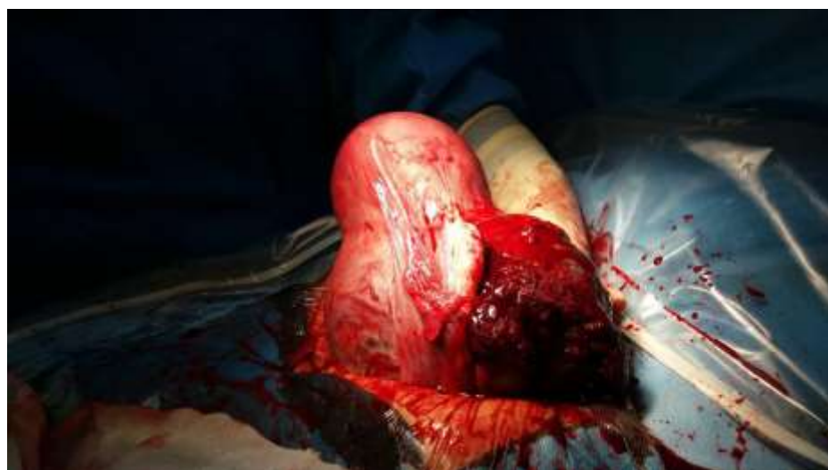
شکل ۳- نمای جانبی رحم همراه با پارگی