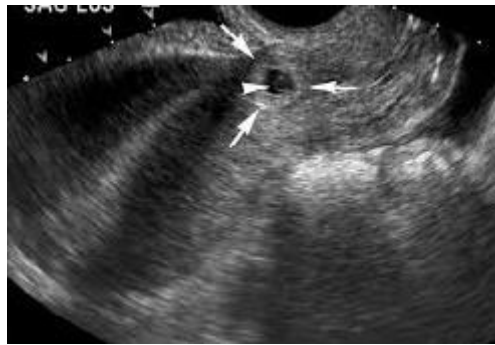
تصویر ۲- سونوگرافی مربوط به بیمار سوم و مشخص شدن ساک حاملگی ۶ هفته و ۵ روز در محل اسکار سزارین