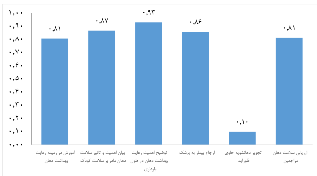
نمودار ۲- نمودار نتایج به‌دست آمده در خصوص عملکرد افراد شرکت کننده در زمینه سلامت دهان و دندان زنان باردار

نتایج به‌دست آمده در خصوص عملکرد افراد شرکت کننده در زمینه سلامت دهان و دندان زنان باردار در نمودار ۲ آمده است. بیشتر شرکت‌کنندگان مراجعین خود را از لحاظ سلامت دهان مورد ارزیابی قرار می‌دادند