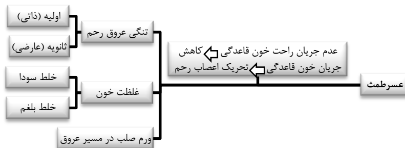
نمودار ۲- علل عُسرطُمْت از دیدگاه طب سنتی ایران

به نظر می‌رسد علت عُسرطُمْت، حساسیت اعصاب رحم ناشی از کاهش جریان خون قاعدگی است که این کاهش جریان خون قاعدگی به دلیل به راحتی جریان نیافتن خون قاعدگی است که تنگی عروق، غلظت خون و ورم صلب علل عدم جریان راحت خون قاعدگی هستند (نمودار ۲).