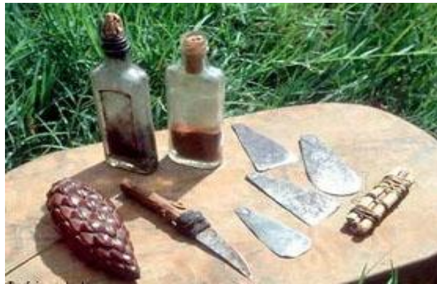
ابزار سنتی قطع آلت تناسلی دختران خردسال

سخت و هراس انگیز است. افرادی که عهده دار این عمل می باشند، به وسیله کارد، قیچی، خط کش، تیغ و حتی بریده شیشه، بخشی از آلت جنسی دختران را قطع کرده و پس از دوخت محل جراحی با نخ؛ با استفاده از روغن، عسل، ماست و برگ درخت باعث قطع خونریزی می شوند (۲). بر اساس طبقه بندی سازمان جهانی بهداشت (۳)، عمل ختنه زنان در غرب آفریقا معمولاً به سه شکل انجام می شود که در نوع اول، کلیتورپس برداشته شده، در نوع دوم تقریباً تمام بخش های بیرونی آلت تناسلی قطع می شود. در سخت ترین نوع آن (نوع سوم)، تنها سوراخ کوچکی برای ادرار و خونریزی ناشی از قاعدگی برجای نهاده می شود. عمل ناقص سازی جنسی زنان در غرب آفریقا معمولاً از سنین ۸ تا ۱۴ سالگی انجام می شود (۴). با این حال، ختنه زنان را نمی توان به سن خاصی منحصر کرد و دختران از بدو تولد تا زمان بلوغ، همواره در معرض ختنه قرار دارند (۵). افرادی که عمل ختنه را انجام می دهند معمولاً زنان سالخورده، قابله ها، پزشکان سنتی و گاه آرایشگران می باشند (۶).